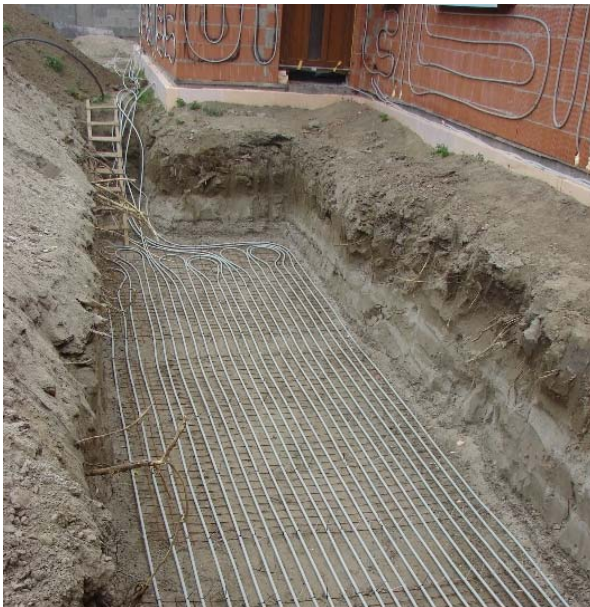
Abb. 5: Bau eines ® ISOMAX-Kühltpeichers

Ohne Solarernte betragen die Anfangstemperaturen im Kühltpeicher ca. +9^\circ\text{C} - +11^\circ\text{C} und im Warmspeicher unter den Gebäuden ca. +12^\circ\text{C} - +13^\circ\text{C} (gemäß Klimazone II und III)