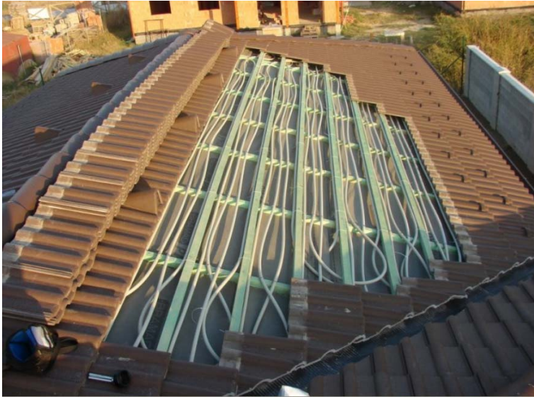
Abb. 10: pp-Rohrleitungen eines ® ISOMAX- Dachsolarabsorbers