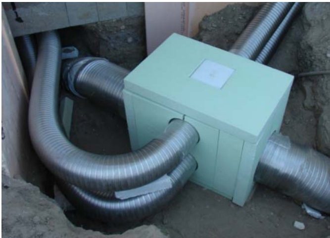
Abb. 12: ® ISOMAX-Rohr-in-Rohr-Luftwärmetauscher - Umlenkung

Als Erfahrungswert sind bei 1,5 m/s, je nach Zuluft-Temperatur, ca. 4 lfd. Rohr-in-Rohr für Delta T = 1 erforderlich.