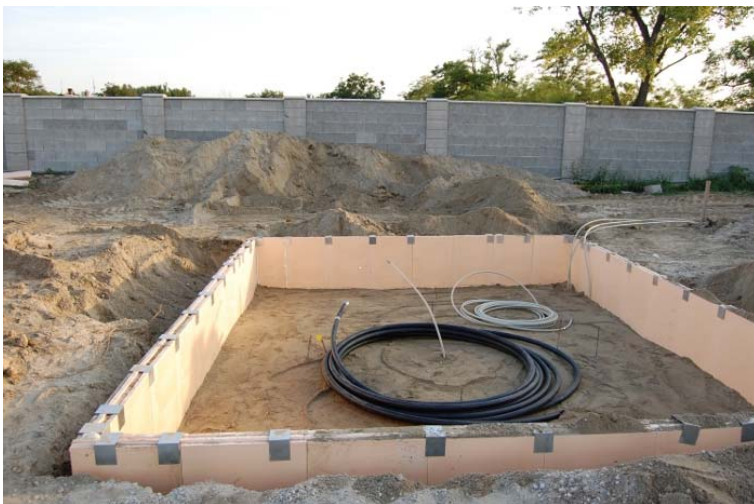
Abb. 4: Bau eines ® ISOMAX-Kernspeichers

Ein zusätzlicher komplett gedämmter Kernspeicher dient der Warmwasser-Vorerwärmung. Dies ist eine Voraussetzung für einen Passivhausstandard. Hier sind ca. 15 m 3 /Person eine empfehlenswerte Speichergröße.