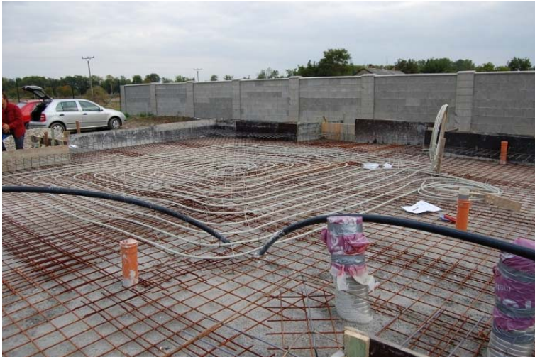
Abb. 6: Bau eines ® ISOMAX-Wärmespeichers