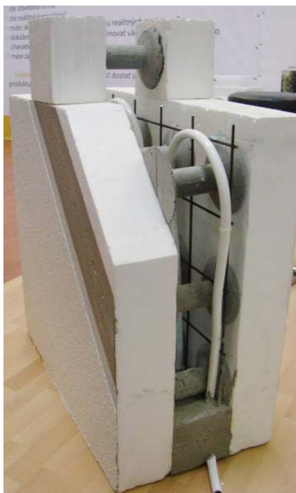
Abb. 8: Aufbau eines ® ISOMAX-Wandelements mit Temperaturbarriere