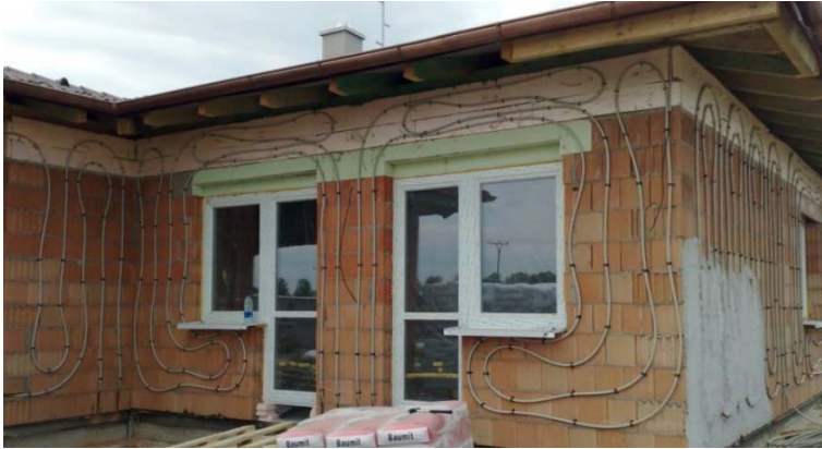
Abb. 9: pp-Rohrleitungen einer ® ISOMAX- Temperaturbarriere

Die ® ISOMAX-Temperaturbarrieren bedeuten nicht nur bei weltweit breiter Einführung eine gigantische Energieeinsparung unter Nutzung umweltfreundlicher und nachhaltiger Energien, sondern sind auch extrem wirtschaftlich und für den do-it-yourself-Einsatz geeignet.