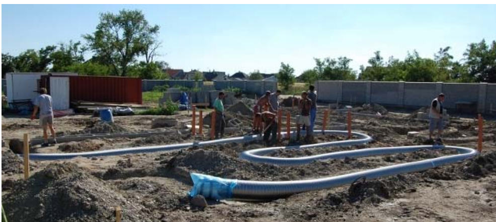
Abb. 11: Verlegung von ® ISOMAX-Rohr-in-Rohr-Luftwärmetauschern

Bauseits wird das ca. 50 – 60 m lange Koaxialrohr „gewickelt“ und, je nach Klimazone, zu 40 - 60 % im Wärmespeicher sowie zu 40 - 60 % im Kühltpeicher verlegt. Der Wirkungsgrad der Luftwärmerückgewinnungsanlage in Form dieses koaxialen Wärmetauschers beträgt über 96 %.